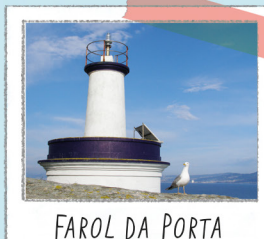
FAROL DA PORTA

Antigo mosteiro de S. Estevo. Na sua exposição interior poderá descobrir o escultor que molda a vida nas ilhas. Consultar horários.