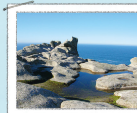
ALTO DO PRÍNCIPE

Uma rocha furada pelo vento e pelo sal. Do observatório mais próximo apreciam-se bonitas vistas do lago e das falésias.