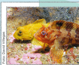
PRAIAS E ÁGUAS

Nas rochas mais próximas das praias vê-se uma grande variedade de vida marinha. Descubra-a com uns óculos de mergulho. Desfrute dela sem lhe tocar. Para usar cinto de mergulho é necessário autorização.