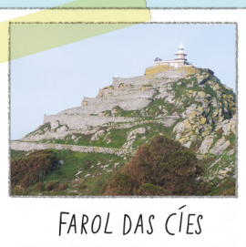
FAROL DAS CÍES

Situado no ponto mais alto visitável. Bom sítio para contemplar a falésia e o voo das gaivotas que ali procriam. Para não alterar as aves, não se aproxime nem as alimente.