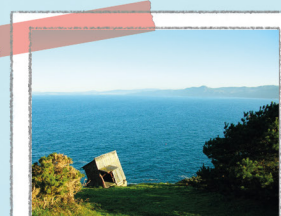
OBSERVATÓRIO DO PEITO

O farol e o observatório do Peito, com uma bonita vista panorâmica das rias. Um belo lugar para observar as aves marinhas que procriam nas falésias: gaivota de patas amarelas e corvo marinho de crista.