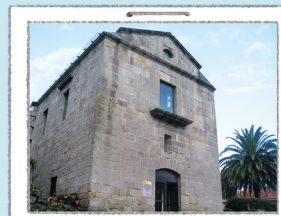
PONTO DE INFORMAÇÃO

Antigo mosteiro de S. Estevo. Na sua exposição interior poderá descobrir o escultor que molda a vida nas ilhas. Consultar horários.