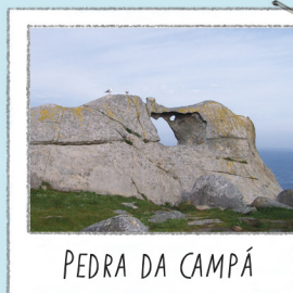
PEDRA DA CAMPÁ

Situado no ponto mais alto visitável. Bom sítio para contemplar a falésia e o voo das gaivotas que ali procriam. Para não alterar as aves, não se aproxime nem as alimente.